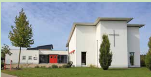
Gemeindezentrum Philipp-Melanchthon-Haus Jettingen-Schepfach